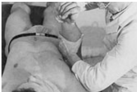
14 Decoaptación por contraapoyo (codo).