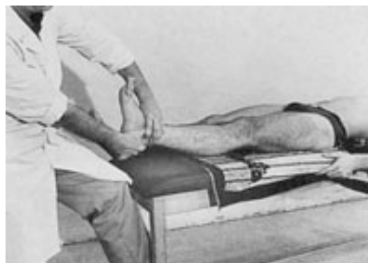
35 Descompresión de la cadera en el eje del miembro inferior.