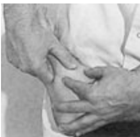
48 Movilización de la articulación innominada.