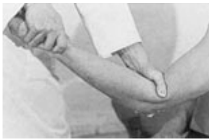
12 Tracción sobre el radio.