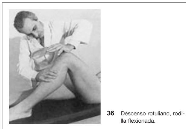
36 Descenso rotuliano, rodilla flexionada.

Una mano, en la cara anterior del muslo, realiza la contratoma y una toma situada en la parte posterior y superior de la pierna ejerce una fuerza de traslación ventral (fig. 37). La movilización en deslizamiento posterior se efectúa de una manera similar.