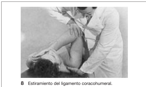
8 Estiramiento del ligamento coracohumeral.