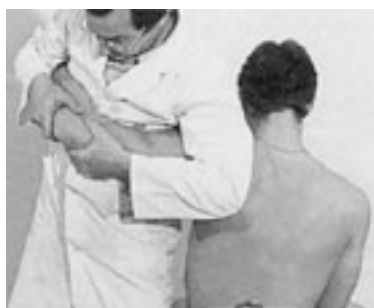
15 Decoaptación por expansión torácica (codo).

terapeuta debe tener cuidado de que el brazo del paciente no sea desplazado con fuerza hacia el extremo caudal, transformando la decoaptación del codo en una maniobra de deslizamiento inferior de la articulación glenohumeral. Su antebrazo, colocado sobre el brazo del paciente, inmoviliza la parte proximal.