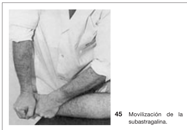
45 Movilización de la subastragalina.