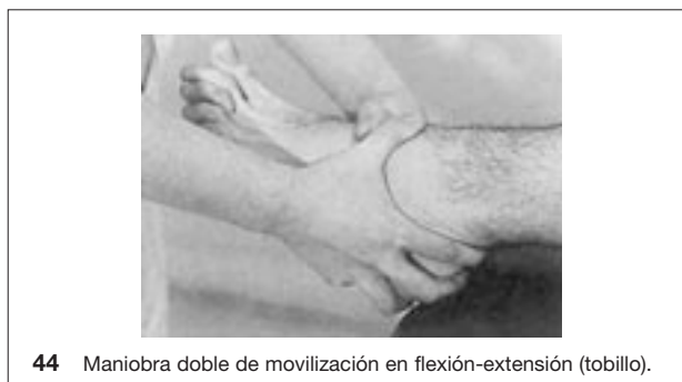
44 Maniobra doble de movilización en flexión-extensión (tobillo).

El paciente está en decúbito lateral, con el pie fuera de la mesa y la rodilla flexionada para distender los gemelos. Se realiza una contratoma encerrando el conjunto maléolo-astrágalo, con la articulación tibiotarsiana en flexión, para