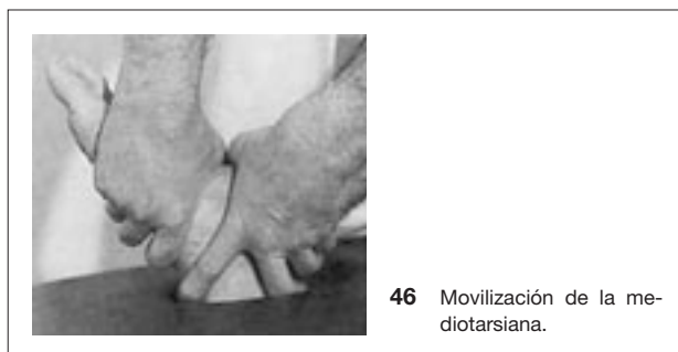
46 Movilización de la mediotarsiana.