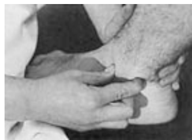
42 Movilización de la femorotibial inferior.