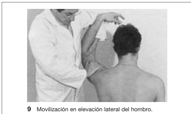
9 Movilización en elevación lateral del hombro.

ción glenohumeral, el deslizamiento medial de la escápula y la participación de las articulaciones acromioclavicular y esternocostoclavicular.