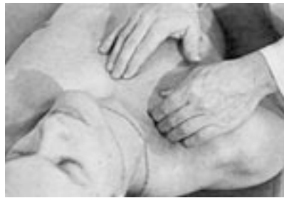
1 Movilización con deslizamiento de la esternocostoclavicular.

— aberturas superiores e inferiores: se obtienen por las movilizaciones con deslizamiento medial y lateral, que pro-