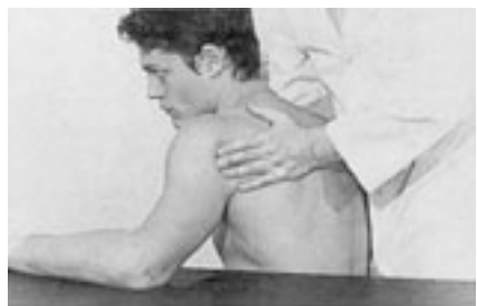
6 Rotación externa de la glenohumeral por deslizamiento anterior y abducción de la escápula.

La movilización en deslizamiento articular de la cabeza humeral produce los mismos resultados. El terapeuta coloca los dedos en la cara anterior y posterior de la cabeza del húmero. El deslizamiento anterior sitúa la escápula en abducción y la articulación glenohumeral en rotación externa. La movilización en deslizamiento posterior realiza una rotación interna. Estos deslizamientos corresponden a los que se asocian a nivel fisiológico a estas rotaciones.