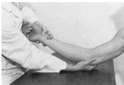
13 Movilización en supinación radiocubital inferior.