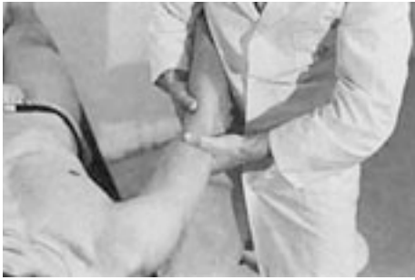
18 Mobilización del codo en extensión.