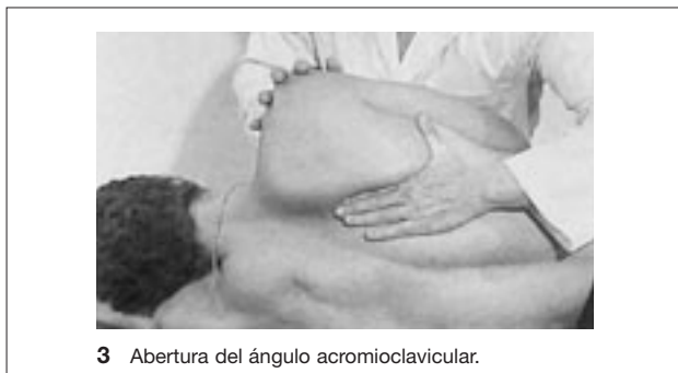
3 Abertura del ángulo acromioclavicular.