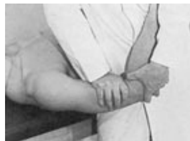
16 Movilización del codo en flexión.