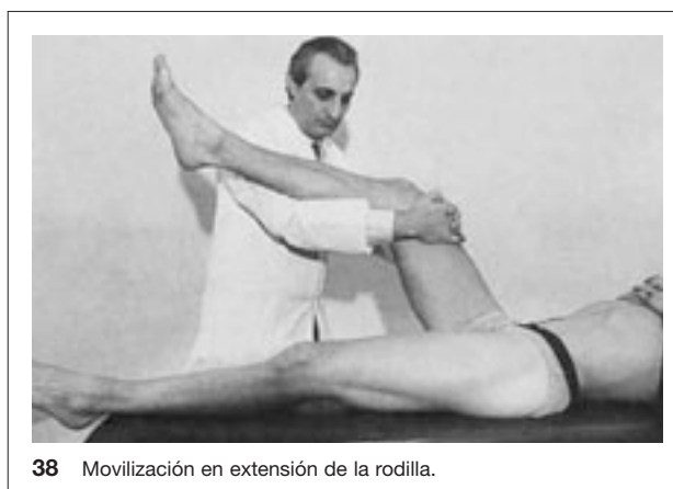
38 Movilización en extensión de la rodilla.