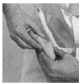
50 Movilización en flexión de la metatarsofalángica del primer dedo.