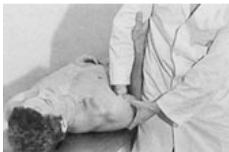
7 Decoaptación de la glenohumeral.

— Deslizamientos anteroposteriores: el paciente está en decúbito supino. El terapeuta sitúa una contraprensión sobre la pinza acromioclavicular y la estabiliza. La otra mano sujeta el muñón del hombro mediante una prensión anteroposterior y realiza un desplazamiento dorsoventral (el desliza-