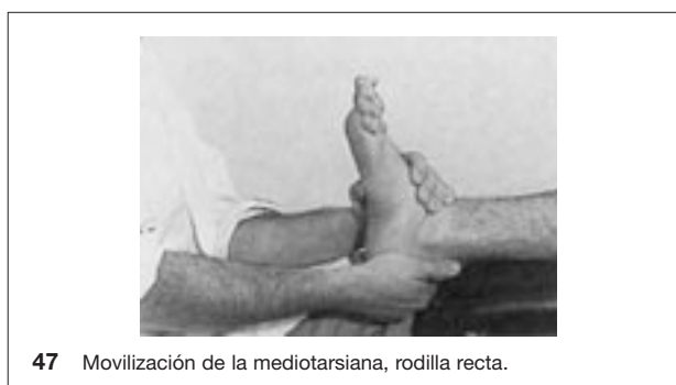
47 Movilización de la mediotarsiana, rodilla recta.

mejorar el bloqueo astragalino. La toma sujeta el calcáneo y realiza movimientos de deslizamiento transversales y de abertura interna y externa (fig. 45).