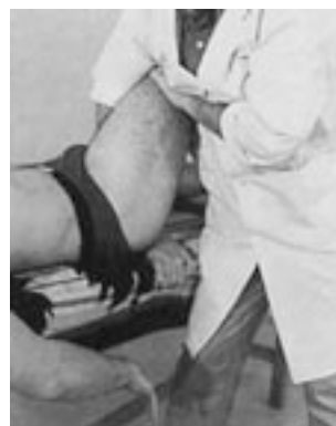
34 Descompresión en el eje del cuello femoral, con contraapoyo.