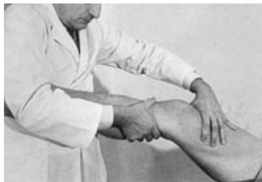
40 Movilización compleja en extensión de la rodilla.

El médico realiza un contraapoyo que fija la tibia por su extremo superior. La presión, realizada entre el pulgar y el índice flexionado, imprime movimientos de deslizamiento de adelante hacia atrás y ligeramente hacia adentro a nivel de la cabeza del peroné. Para mayor comodidad, la presión puede realizarse por apoyo de la eminencia tenar.