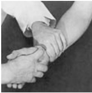
19 Mobilización de la muñeca en descompresión.