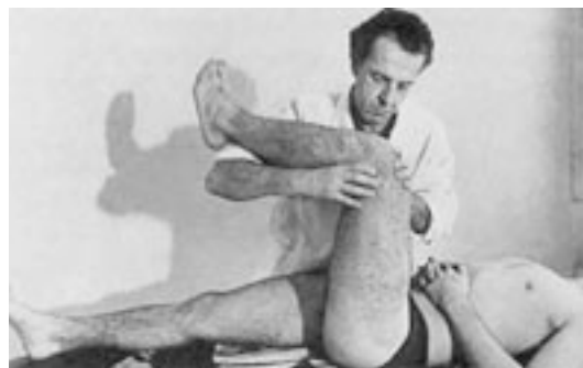
32 Movilización en rotación, cadera en flexión.

No se trata de una decoaptación, sino de técnicas que permiten poner en tensión los elementos periarticulares que actúan en el eje del cuello del fémur.