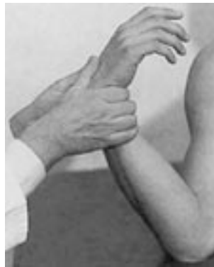
21 Mobilización en flexión (muñeca).

de movilización selectiva de cada hueso en relación con los huesos adyacentes.