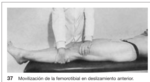
37 Movilización de la femorotibial en deslizamiento anterior.