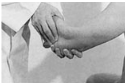
11 Movilización de la cabeza del radio.