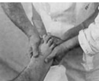
49 Movilización llamada en «ala de mariposa» de Lisfranc.

toma con tres dedos realiza deslizamientos de arriba hacia abajo alternativamente sobre el escafoides y el cuboides.