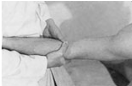
10 Movilización del codo en lateralidad.