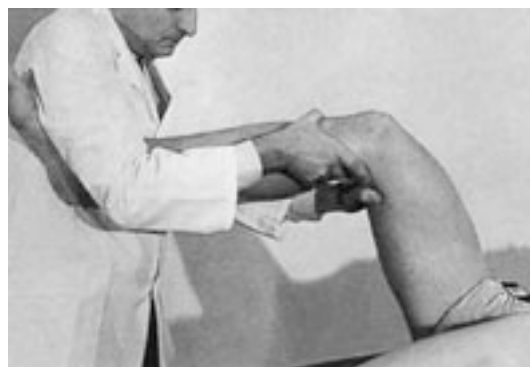
41 Movilización compleja en flexión de la rodilla.