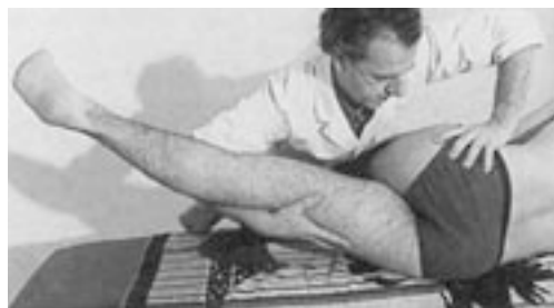
31 Movilización de la cadera en aducción.

médico, colocado frente al paciente, realiza una contratoma dirigida hacia abajo y hacia adentro, sobre la cresta ilíaca contralateral, evitando la lateroversión de la pelvis. La toma en bóveda, situada sobre la cara externa del muslo, realiza el movimiento de aducción (fig. 31).