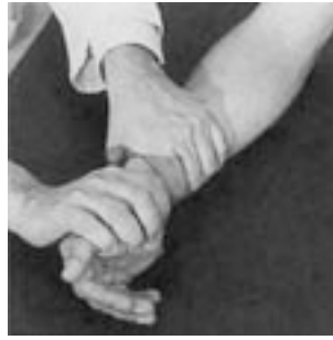
20 Mobilización en deslizamiento ventrodorsal (muñeca).