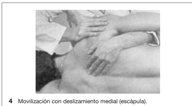
4 Movilización con deslizamiento medial (escápula).

la a una posición sagital en la abducción y frontal en la aducción;