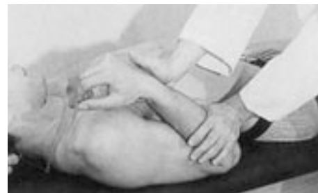
17 Movilización de los últimos grados de flexión del codo.