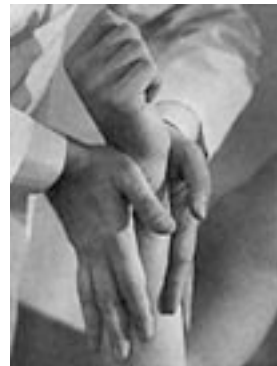
22 Mobilización por deslizamiento tisular (muñeca).

La toma se aplica a las caras radial y cubital de la primera fila inmediatamente por debajo de las estiloides y la contratoma fija el antebrazo. Después de una descompresión, el desplazamiento se efectúa en sentido tangencial a la dirección de la glena, es decir oblicuamente hacia afuera y en dirección distal. Estos desplazamientos son indispensables para la movilidad en inclinación radial y cubital.