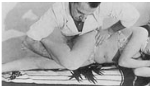
27 Movilización en flexión de la coxofemoral en decúbito lateral.

El paciente está en decúbito supino. La cadera que no es movilizada se coloca en abducción a fin de retrasar la compensación en lateroversión. El médico se coloca homolateralmente a la altura de la cadera que se va a movilizar. La toma en bóveda sostiene el miembro inferior y realiza el movimiento. El mantenimiento de la rótula en alto permite comprobar la ausencia de rotación asociada. La contratoma puede situarse en la cresta ilíaca, dirigida hacia abajo y hacia dentro, evitando la compensación de la pelvis en lateroversión. Esta contratoma puede ser sustituida, en ciertos casos, por un contraapoyo a la altura del trocánter mayor (fig. 30) permitiendo entonces que la cabeza femoral se recentre al oponerse al componente luxante de los músculos longitudinales puestos en tensión durante el movimiento