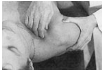
2 Movilización de la acromioclavicular por la clavícula.

vocan una abertura superior en el primer tipo de movilización y una abertura inferior en la movilización con deslizamiento lateral (cf Movilización de la escápula);