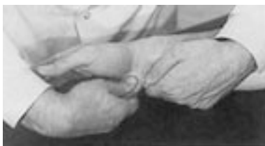
23 Movilización del hueso ganchoso con relación al piramidal.

parte de la columna fija de la mano con el segundo y tercer metacarpianos, su proyección cutánea dorsal es pequeña e inclinada y su cara ventral no es abordable.