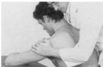
5 Abducción de la glenohumeral por deslizamiento inferior.