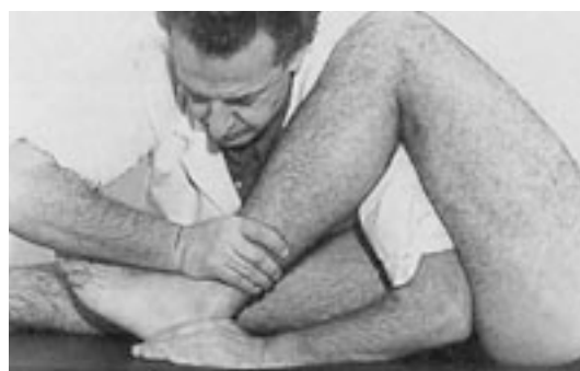
43 Deslizamiento posterior de la tibia (tobillo).