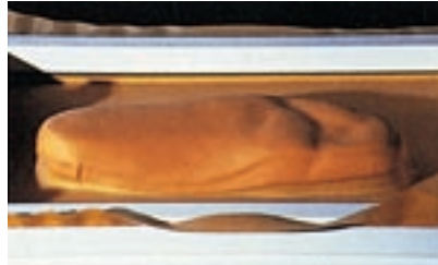
3 A. Moldeado sobre un positivo del pie.