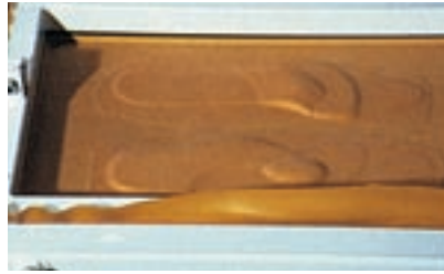
2 Plantillas termosoldadas en plano.