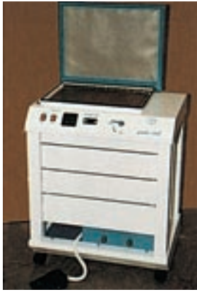
1 Minilaboratorio podológico (Podiatech).