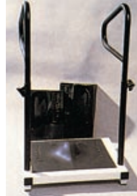
3 B. Plancha de termomoldeado.