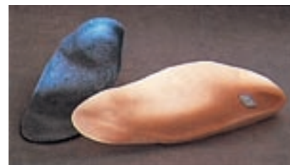
13 Plantillas moldeables antes del recubrimiento.